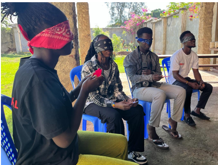
Ein Moment aus dem Workshop mit dem Elimu-Team

Doch bevor ich etwas sagen konnte, sprang einer meiner Kollegen auf. „Ich habe die Datei hier“, sagte er, verband seinen Laptop mit dem Bildschirm und begann, das Dokument vorzustellen. Ich sass einfach da und schaute zu. In diesem Moment wurde mir klar: Genau so soll es sein.