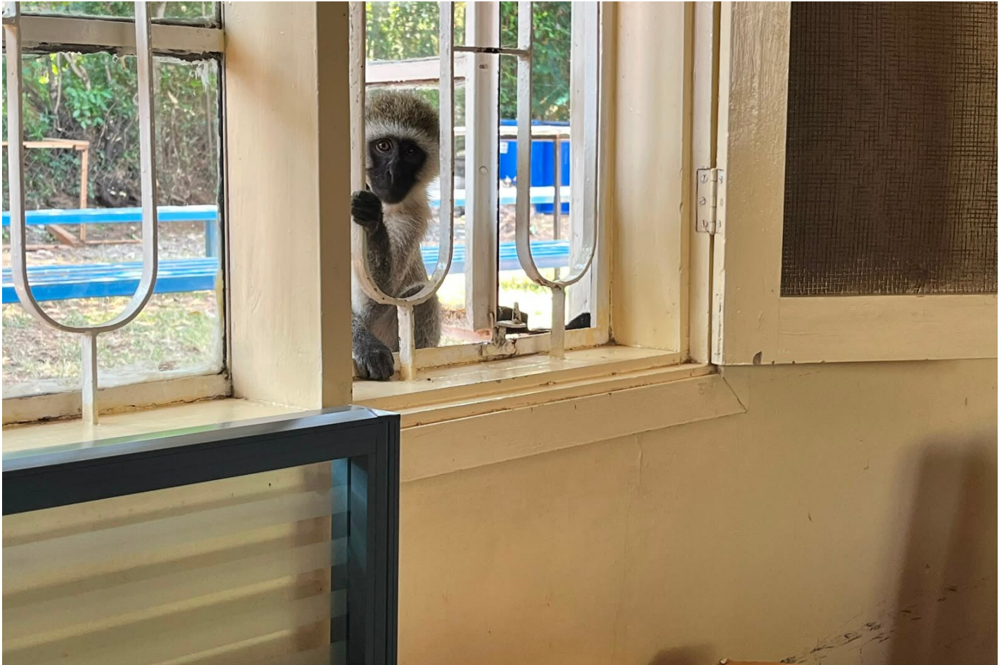
Affe am Bürofenster