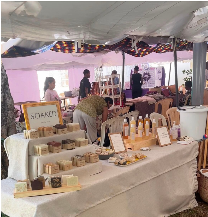
Ujima Community Flehmarkt

Für mich war die Veranstaltung ein schönes Bild davon, wie Unternehmertum entsteht. Nicht immer beginnt es mit einem Businessplan. Manchmal beginnt es mit einem kleinen Stand, einem selbst hergestellten Produkt und der Möglichkeit, es anderen zu zeigen.