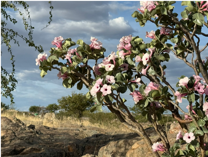
Flora in Kowares (Besuch der Kephass Muzuma Schule)