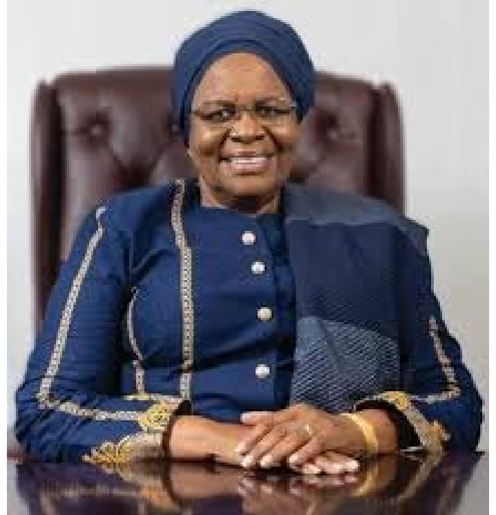
Dr. Netumbo Nandi-Ndaitwaham