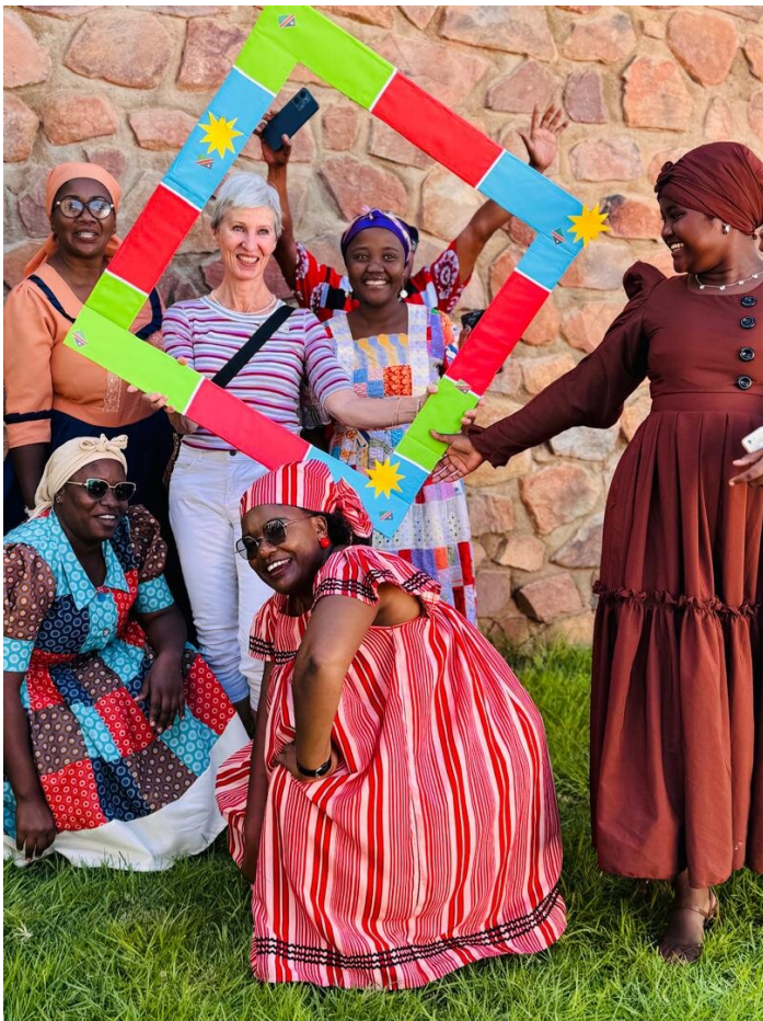
Bereit für die Feier des Unabhängigkeitstags, 21.3.26

Meine Partnerorganisation ist das Directorate of Education, Innovation, Youth, Sports, Arts & Culture, kurz DEIYSAC, in der Kunene Region (auf deutsch ist es das Direktorat für Bildung, Innovation, Jugend, Sport, Kunst und Kultur). In allen Regionen Namibias gibt es ein DEIYSAC, die zentral vom Ministry of Education, Innovation. Youth, Sports, Arts & Culture geführt werden.