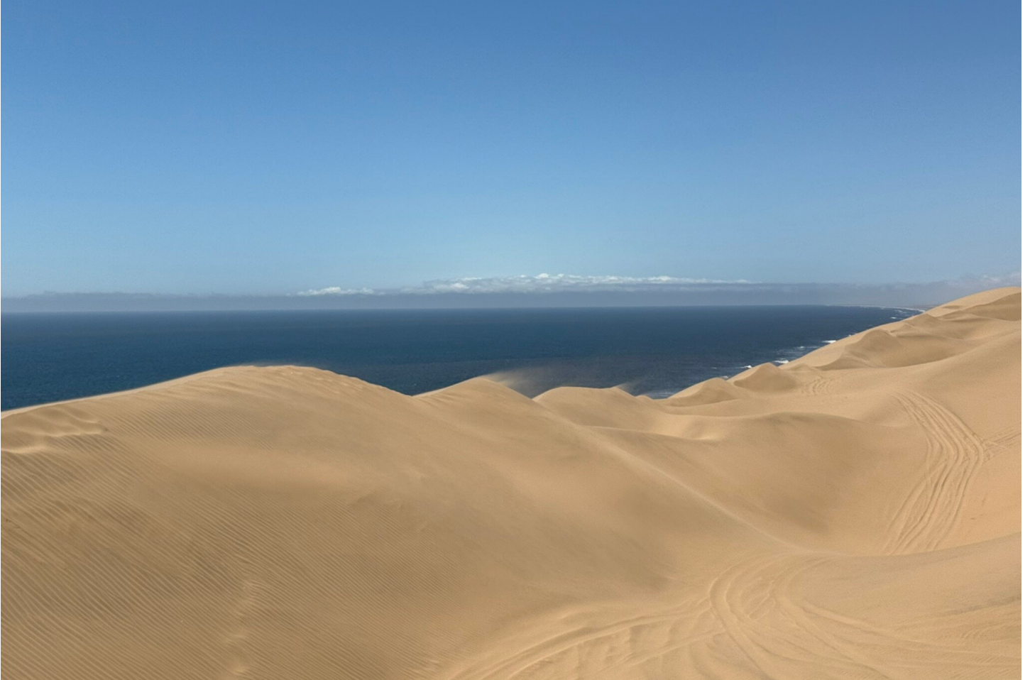
Sandwich Harbour an der Skelettküste