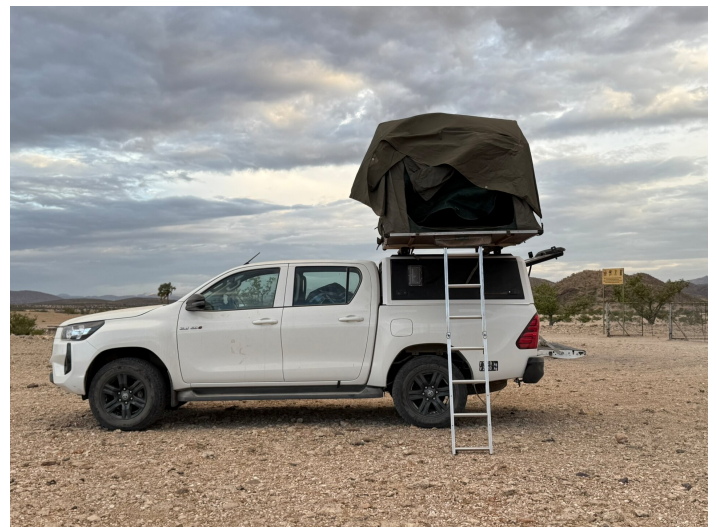
Dachzelt - einzige Übernachtungsmöglichkeit in Otjuu.

Bei unserem Besuch in Otjuu im Kaokoveld mussten wir daher auch mangels Alternativen im Zelt übernachten. Zum Glück hatte ich mein Dachzelt dabei!