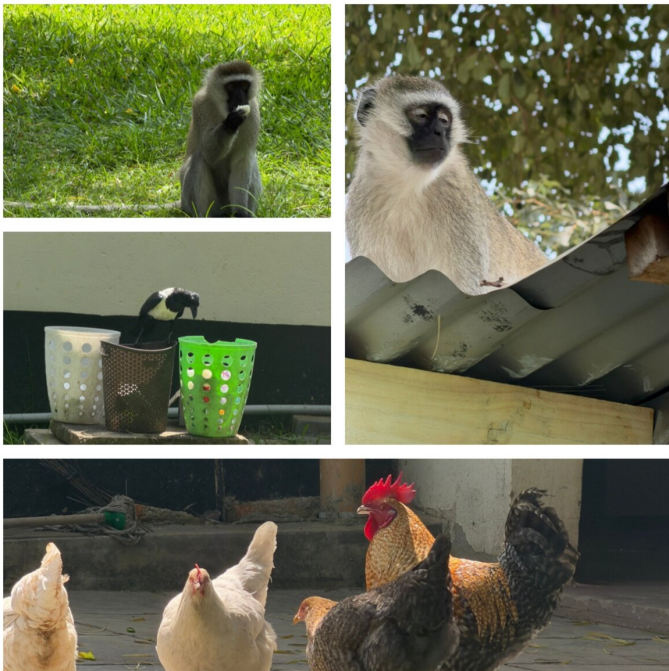
Wilde Tiere im Garten des Main Office in Kisumu

Schwimmen im Nyanza Club, Cappuccino im Java, Hängematte auf dem Balkon, Abende im Dunga Hill Camp, Chor. Dazu Ausflüge: nach Nairobi für Kitenge-Stoffe, ein Wochenende in Maili Saba, die heißen Quellen von Bala Lawi und der Felsen Kit Mikayi – angekündigt als Wanderung, in Wahrheit ein Kraxelspaziergang zwischen Pilgern.