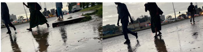
Regen in Kisumu

Zwischen sieben Euro und 1000 Schilling.