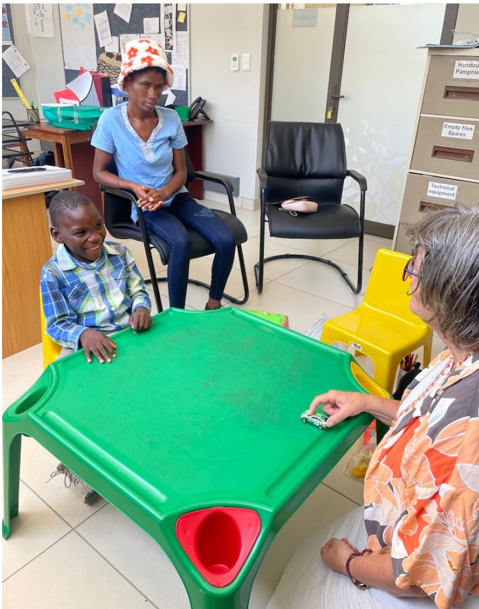
Abklärung eines Jungen. Seine Mutter ist auch dabei.

Zu Beginn des Schuljahres wurde unsere Abteilung mit Anmeldungen von Kindern mit mittleren bis starken Lernbehinderungen regelrecht überflutet. Einerseits ist dies eine positive Entwicklung, da sie zeigt, dass Gesellschaft und Schule offener gegenüber Menschen mit Behinderung werden. Zudem bietet jede Abklärung eine praktische Lernerfahrung für das Team. Andererseits ist die Situation auch ernüchternd. Fast alle Kinder, die wir abklärten, benötigen eine spezialisierte und individuelle Förderung. Da es in Ohangwena jedoch viel zu wenige Förder- und Schulungsangebote für Kinder mit geistigen Behinderungen gibt, können wir den Familien oft nur begrenzt weiterhelfen. Häufig beschränkt sich unsere Unterstützung darauf, Eltern und Lehrpersonen praktische Hinweise zu geben, wie sie die Kinder im Alltag und im Unterricht besser fördern und einbinden können.