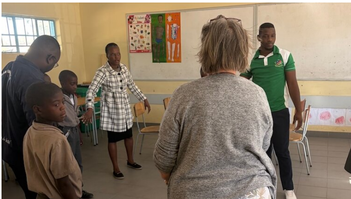
Bei den Trainings übernimmt Shiimi eine aktive Rolle