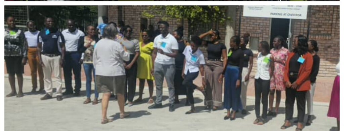
Die Trainings mit den Life Skills Lehrpersonen