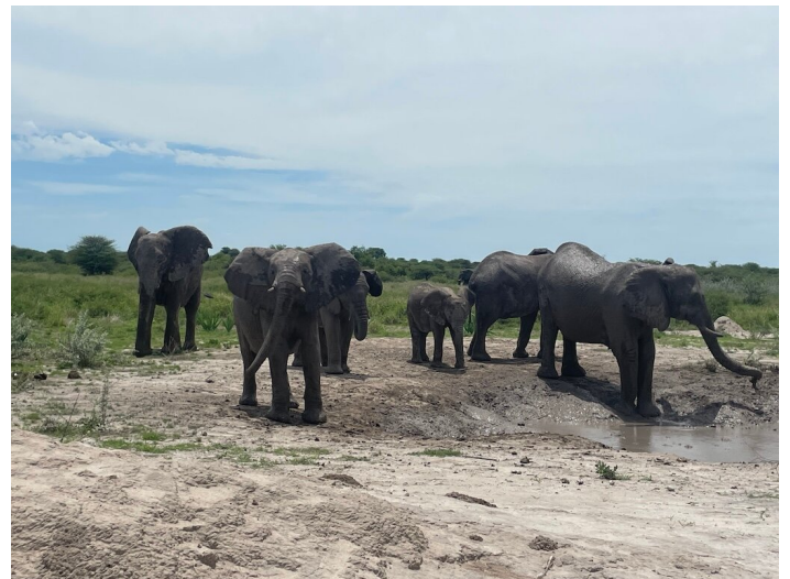
Elefanten: Inbegriff von Kraft in der Gemeinschaft