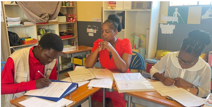
Erstellen von individuellen Förderplänen

"Tropfen auf einen heißen Stein" oder "viele kleine Tropfen geben einen Ozean"?