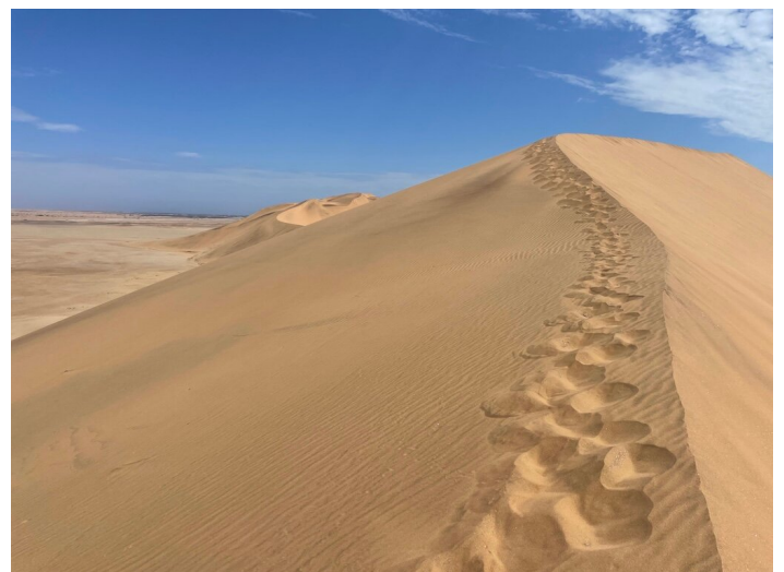
In der Stille der Wüste zur Ruhe kommen