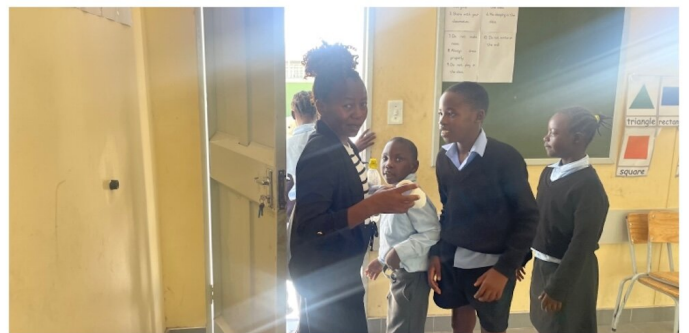
Neue Sonderklassen in zwei Schulen