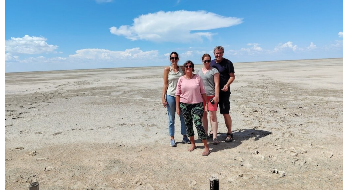
Die Weite der Etoshapfanne mit treuen Freund:innen