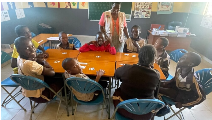
Eine Woche Einblick bei etablierten Sonderklassen