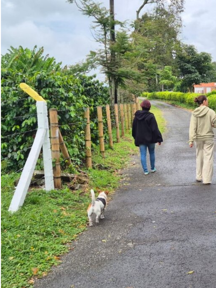
Auszeit in der Kaffeeregion Quindío