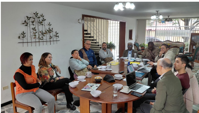
Sitzung in der Fundación para la Reconciliación

Ein zentraler Teil meines Auftrags besteht darin, interne als auch externe Kommunikationsstrukturen zu analysieren und weiterzuentwickeln. In der Praxis bedeutet das, bestehende Abläufe zu reflektieren, neue Ansätze zu testen und gemeinsam mit dem Team Wege zu finden, wie Wissen, Erfahrungen und Ergebnisse besser dokumentiert, geteilt und sichtbar gemacht werden können. Dabei wurden erste Schritte angestoßen: etwa der Versuch, ein institutionelles Ablagesystem zu etablieren, die Durchsetzung einer Kommunikationsstrategie oder die Stärkung der digitalen Präsenz. Insbesondere die Zusammenarbeit mit Praktikantinnen bringt wertvolle Unterstützung und neue Erfahrungen als auch frische Perspektiven und Energie mit sich.