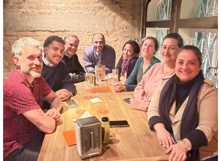
Comundo Besuch aus der Schweiz

Schliesslich wird mir in meiner Arbeit mit der Fundación para la Reconciliación deutlich, wie eng diese politischen Dynamiken mit den von uns begleiteten Prozessen verbunden sind und eine zusätzliche Dimension erhalten. Versöhnung geschieht nicht im luftleeren Raum. Sie steht immer in Wechselwirkung mit Fragen von Gerechtigkeit, Anerkennung und Zukunftsaussichten. Ausserdem zeigt sich, dass gesellschaftlicher Frieden nicht allein auf politischer Ebene entschieden wird, sondern sich in unzähligen kleinen Begegnungen und Beziehungen widerspiegelt.