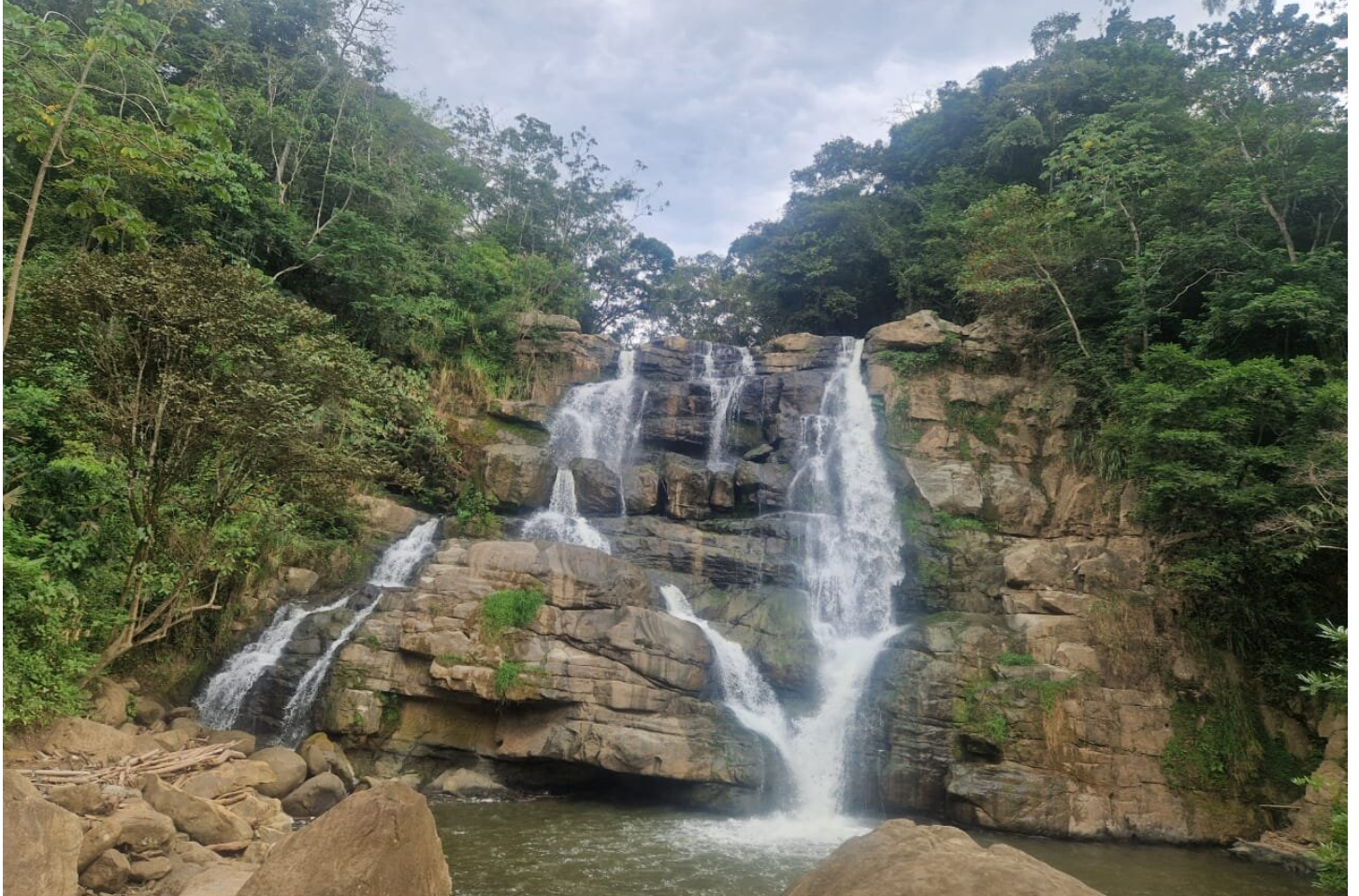
Salto de Versalles - Guaduas

Oftmals frage ich mich, inwiefern ich mich tatsächlich im Fluss befinde. Ich erkenne keine eindeutige Strömung. Manchmal zieht's und manchmal steht's still.