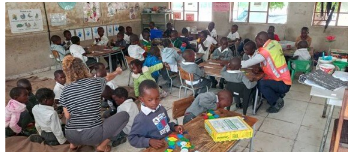
Schulische Integration: Wir unterstützen Kinder beim Zugang zu Bildung und stärken Lehrpersonen in inklusiver Bildung.