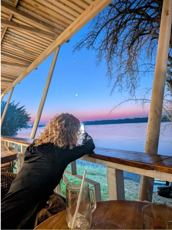
Sonnenuntergang und Mondaufgang über dem Zambezi

Von Fabienne Strebel - Inklusive Bildung für alle Ein Personaleinsatz von Comundo