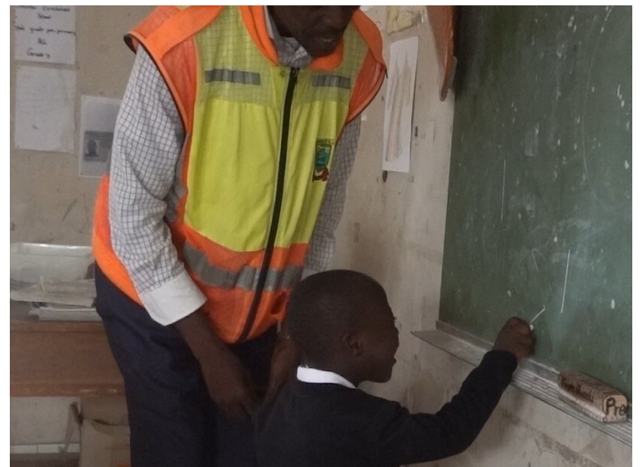
Integration eines Mädchens mit Trisomie 21 in die 1. Klasse einer Regelschule.