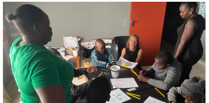
Gemeinsam lernen an der Hope School

Wenn Menschen also sagen: „ We do it the African way “, dann denke ich inzwischen an diese Schule. An den Mut, etwas zu beginnen, obwohl noch nicht alle Antworten vorliegen. An den Fokus auf das Wesentliche. Und an die Bereitschaft, unterwegs zu lernen.