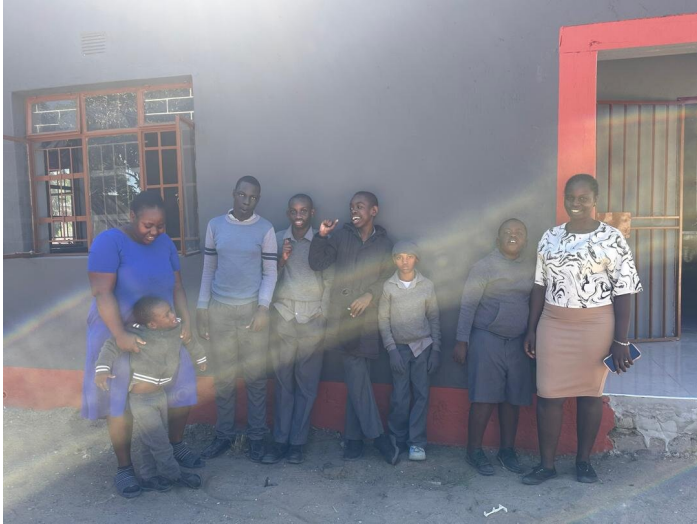
The Hope School

Von Fabienne Strelbel - Inklusive Bildung für alle Ein Personaleinsatz von Comundo