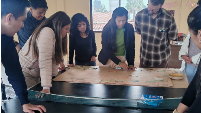
Formation - Systèmes agroforestiers

De Michael Tschumi - L'agroécologie pour assurer une alimentation saine Un projet de coopération par l'envoi de personnes de Comundo