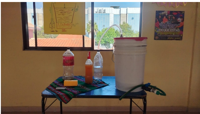
Fermenteur Bokashi fait maison

Nous avons consacré plusieurs semaines à préparer un manuel complet sur le compostage: des aspects les plus techniques: température, humidité, rapport carbone/azote , jusqu'aux plus pédagogiques: comment expliquer à une famille ce qu'est le compost sans que cela ressemble à un cours de chimie ? Nous avons également conçu une formation qui s'est affinée au fil de nombreuses versions.