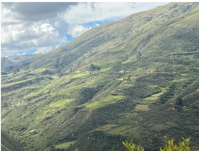
Vue depuis Incallajta – Valle Alto Cochabamba

L'incertitude existe, je ne vais pas prétendre le contraire. Mais de là où je suis, la réponse ne peut être la paralysie. Au contraire: ce sont justement ces moments qui confirment la valeur d'un travail enraciné localement, construit avec les personnes et pour les personnes. Nous continuons avec confiance, optimisme et les pieds bien ancrés dans cette terre qui nous enseigne tant. Voilà donc deux images de ce pays si beau.