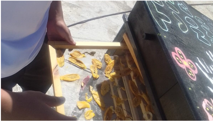
Séchoir solaire en fonctionnement

Celles et ceux qui ont lu ma précédente lettre se rappelleront des six séchoirs solaires construits avec les familles de San Benito. À l'époque, je vous racontais les premiers essais, les pommes qui ont disparu avant que nous puissions les documenter et les bananes qui ont un peu collé. Eh bien, il y a du nouveau.