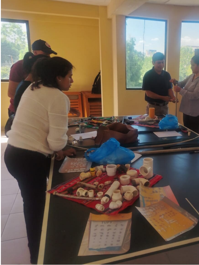
Formation plomberie

De Michael Tschumi - L'agroécologie pour assurer une alimentation saine Un projet de coopération par l'envoi de personnes de Comundo