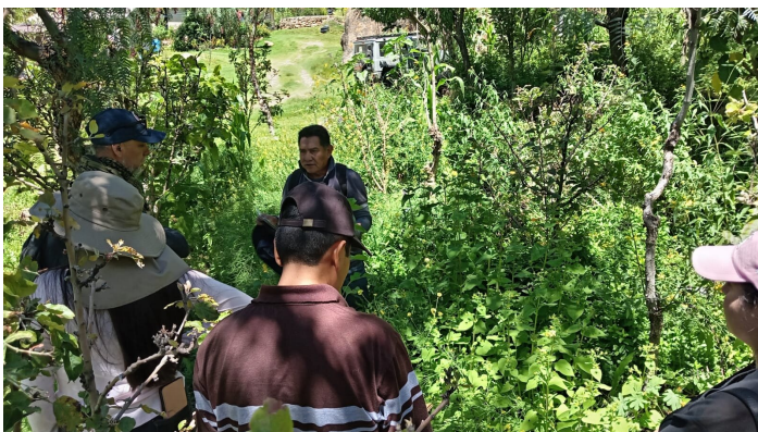
Ecocampo Suelo Feliz - Systèmes agroforestiers

Les systèmes agroforestiers successifs ont pour objectif clé l'amélioration et la protection du sol et de la vie qu'il porte.