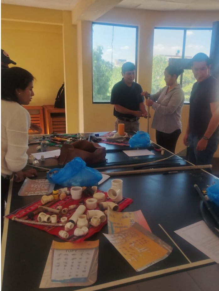
Capacitación plomería

Por Michael Tschumi - Garantizar una alimentación saludable Un Intercambio con Comundo