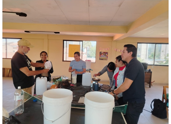
Multiplicación Microorganismos

La primera capacitación con el equipo de la Fundación Ayni fue intensa y muy rica. Hubo preguntas que no esperaba, debates que se alargaron más de lo planificado – siempre buena señal.