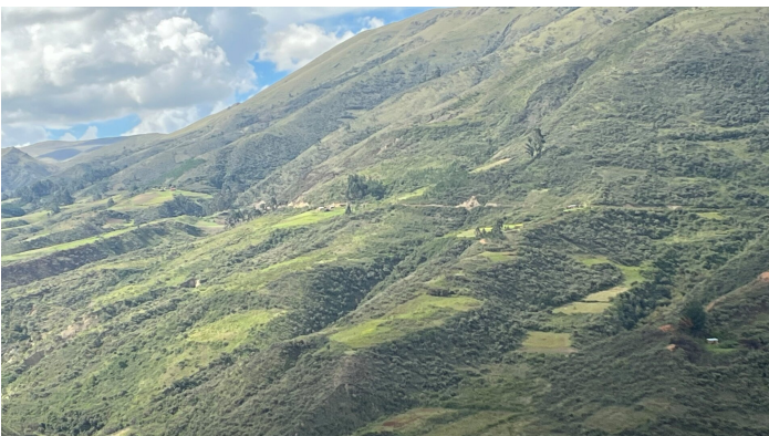
Vista desde Incallajta - Valle Alto Cochabamba

La incertidumbre existe, no voy a pretender que no. Pero desde donde estoy, la respuesta no puede ser la parálisis. Al contrario: son justamente estos momentos los que confirman el valor de un trabajo enraizado en lo local, construido con las personas y para las personas. Seguimos con confianza, con optimismo y con los pies bien plantados en esta tierra que tanto nos enseña. Por eso dos imágenes de este país tan lindo.