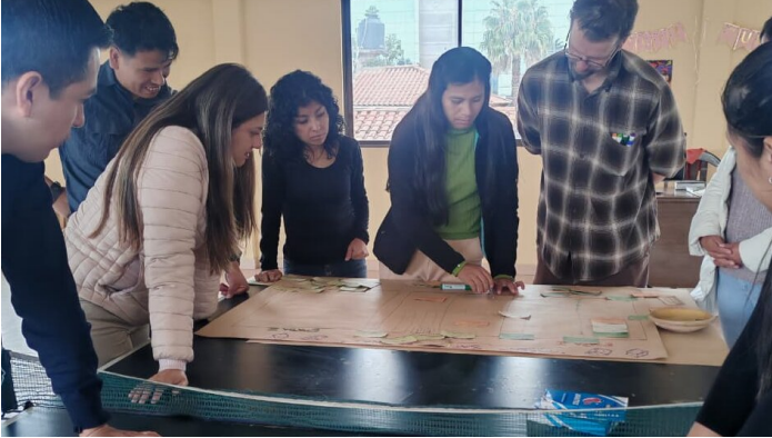
Capacitación - Sistemas Agroforestales

Por Michael Tschumi - Garantizar una alimentación saludable Un Intercambio con Comundo