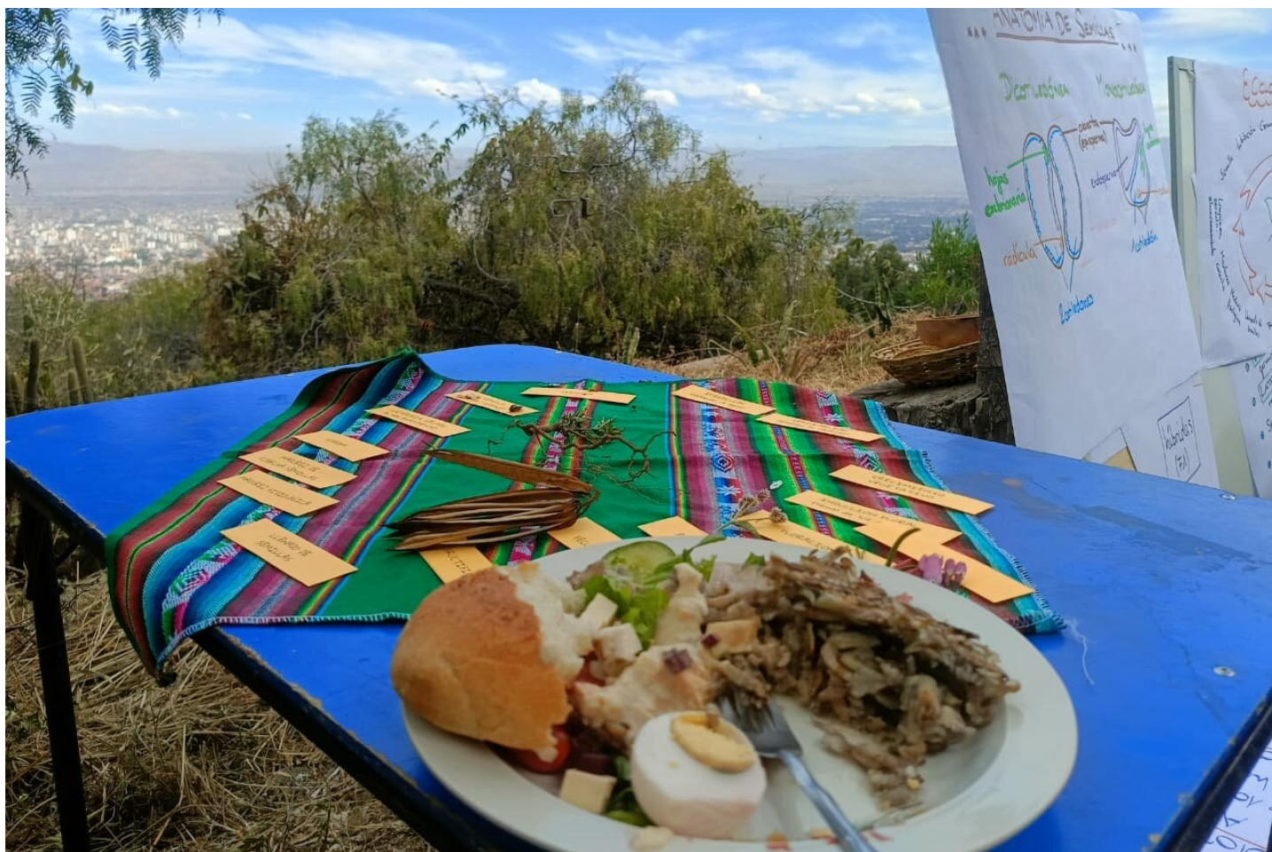
Almuerzo en una capacitación al aire libre: Rösti de papas bolivianas

Querida familia, queridas amigas y amigos, queridas compañeras y compañeros de camino,