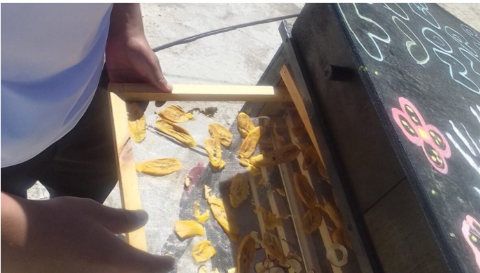
Deshidratadora funcionando

Lo que más me alegró fue que sin visita programada, sin acompañamiento de nuestra parte, las familias protegieron las deshidratadoras durante toda la época de lluvias. En cuanto llegó la temporada seca, las pusieron en marcha por su propia cuenta, sin que nadie les recordara, sin esperar instrucciones. Eso, en el trabajo de cooperación, es lo que más vale