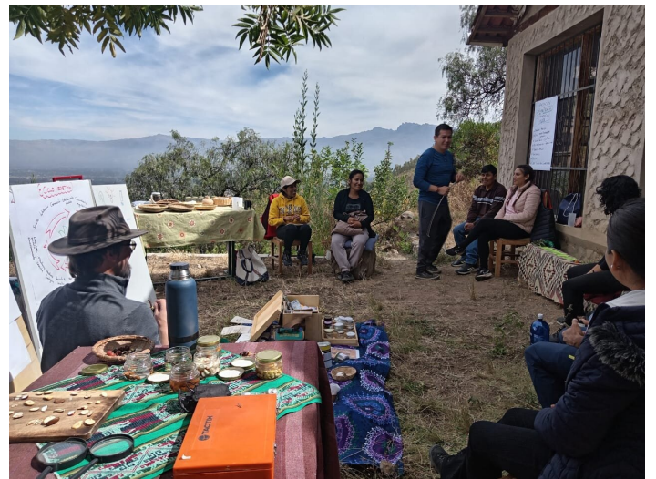
Capacitación Semillas - Fundación Ayni

Ahora, gracias a nuevas donaciones, podemos ampliar este proyecto a 12 familias más y 2 escuelas adicionales.