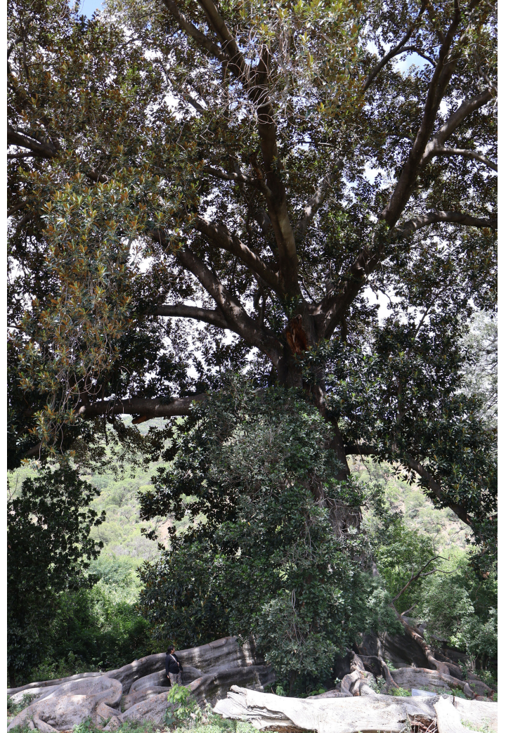
Árbol tricentenario

Muchas gracias por acompañarme en este camino, por leer, por preguntar, por escribir. Cada mensaje que recibo es una señal de que no trabajamos solitariamente.