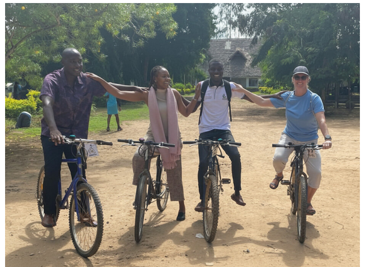
Trainers und TAF Mitarbeiter bereit für den Community-Einsatz

Durch ihr Wissen, ihre Erfahrungen und das DPRP-Programm verfügen sie nun über die nötigen Fähigkeiten und eine positive Haltung gegenüber Menschen mit Behinderungen, die sie in ihre künftige Arbeit weitertragen werden.