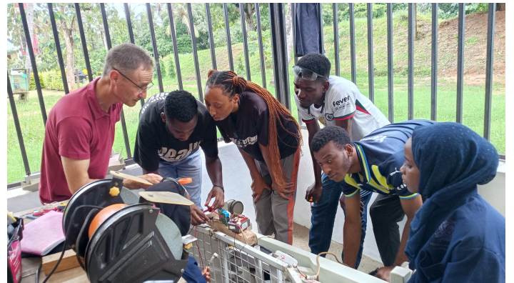
Studenten bei der Fehlersuche an einem elektrischen Bett

„Die Auswirkungen sind messbar. Indem wir eine realitätsnahe technische Umgebung in der Werkstatt nachgebildet haben – mit mechanischen, elektrischen und elektronischen Komponenten – haben wir die ‚Vertrauenslücke‘ effektiv geschlossen. Unsere Studenten beginnen ihre Praktika nicht mehr mit der Frage, ob sie die Arbeit bewältigen können. Sie verfügen über die praktischen Fähigkeiten, die sie benötigen, um lebensrettende Geräte zu warten und Fehler zu beheben.“