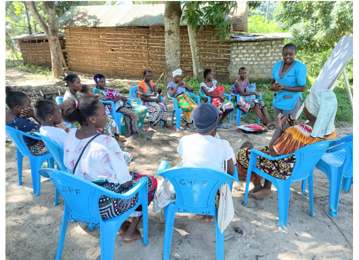
Einsatz in der Community: Gesundheitsfördernde Informationen durch Studierende

Auch ich blicke auf die letzten drei Jahre meiner Arbeit zurück und reflektiere, was ich lernen durfte und was ich bewirken konnte. Rückblickend wird mir klar, dass ich in allen Bereichen des „Competence Based Learning“-Systems (siehe Rundbrief 2) an der NCMTC tätig war: In der Theorie, im Skills Lab und bei der praktischen Arbeit der Studierenden in den Communities (Primary Health Care Network, PHC). Letzteres ist ein zentraler Bestandteil des NCMTC, um die primäre Gesundheitsversorgung (PHC) zu stärken und den Studierenden die Bedeutung dieses Ansatzes für das gesamte Gesundheitssystem zu vermitteln.