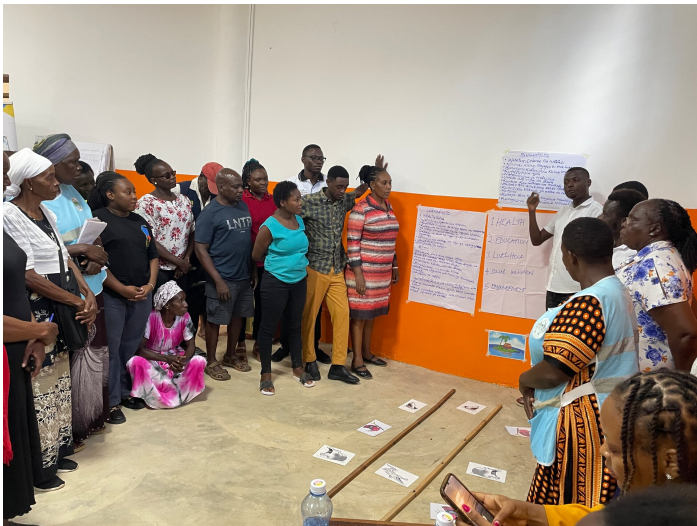
Training CHP's und Staff DPRP

Das DPRP-Programm erwies sich als genau das, was wir gesucht haben, da es unmittelbar an unsere bisherige Arbeit anknüpft. Inzwischen konnten wir eine gute Zusammenarbeit mit TAF und dem College aufbauen. Gemeinsam haben wir verschiedene Trainings auf Provinzebene (Ministry of Health and Social Services) durchgeführt, sowohl für Lehrpersonen des Colleges als auch für die Community Health Promoters, bei denen das Thema „Behinderung“ im Mittelpunkt stand. Zudem haben wir zusammen mit den Studierenden erste Aktivitäten in den Gemeinden umgesetzt.