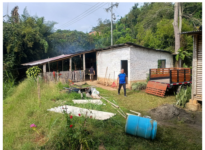
Une des maisons (en mauvais état) à reconstruire.