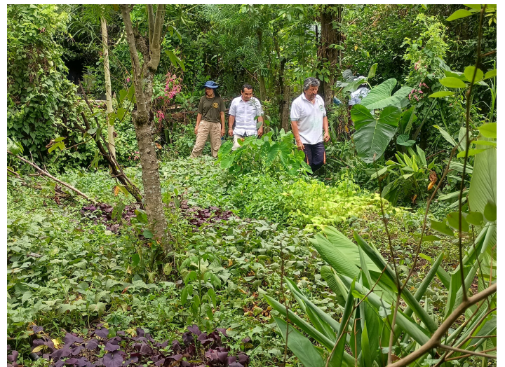
Un des jardins de plantes comestibles