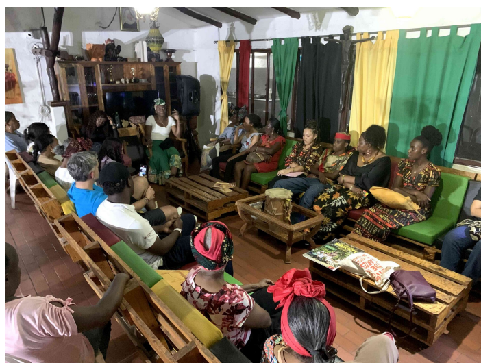
Avec les jeunes afrocolombien.ne.s de l'est de Cali

Nous travaillons autour de différentes thématiques: justice restaurative, paix urbaine et droits humains notamment. Nous allons suivre une dynamique participative pour partager les savoirs de chacune des organisations. Les jeunes seront au coeur du processus puisqu'ils animeront les ateliers. Nous prévoyons de former 40 jeunes (10 par organisation partenaire de Comundo). Le but est également que ces jeunes issu.es de quartiers différents apprennent à se connaître, à partager les problématiques qui les touchent et à tisser un réseau que Comundo va soutenir. Comundo n'impose pas; elle accompagne.