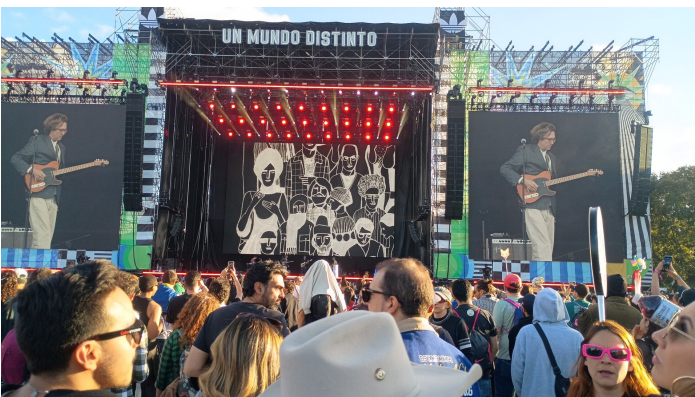
Festival de musique à Bogotá. Notre Paléo local: FEP