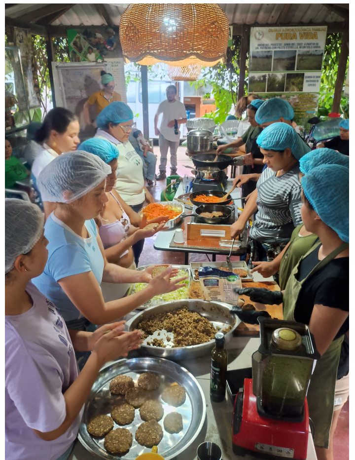
Atelier collectif de transformation d'aliments

L'une d'entre elle était un atelier de transformation d'aliments à partir des produits agroécologiques avec l'objectif de cuisiner sans jeter d'aliments. Il fallait tout utiliser. Pour atterrir un peu l'information, je vous donne un exemple d'un produit que nous avons cuisiné. Nous avons réalisé un hamburger avec une viande végétale. Jusque-là rien d'anormal.