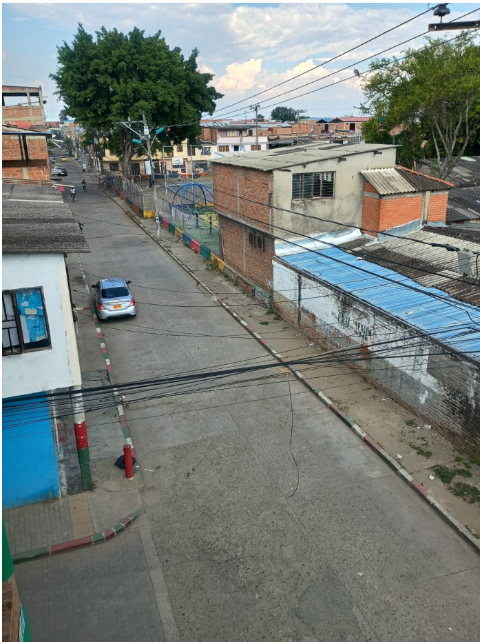
Vue depuis la fondation Paz y Bien

Il y a plus d'un mois, j'ai commencé ma nouvelle mission à Cali avec la fondation Paz y Bien. En réalité, la fondation se trouve à l'est de Cali, dans le district d'Aguablanca, une extension de la zone urbaine de Cali. Cette région de la ville abrite les couches de la population les plus pauvres. A la différence de la partie sud et occidentale (collée aux montagnes), la population d'Aguablanca est une population à grande majorité afrocolombienne souvent issue de la migration venue du Pacifique colombien. Les différences s'observent également au niveau de l'aménagement du territoire. La pauvreté c'est aussi cela: comment l'espace urbain est construit, les routes et les rues, les espaces verts, etc.