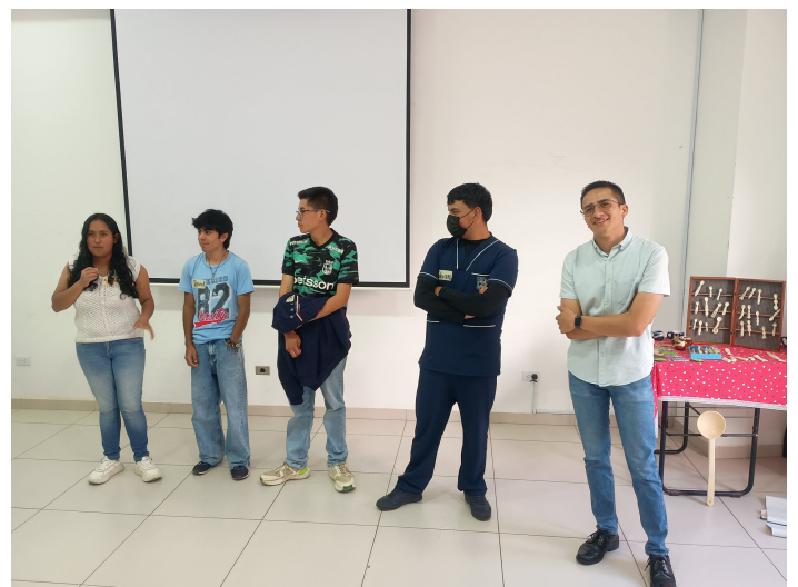
Jeunes du village de Saboyá (Boyacá)