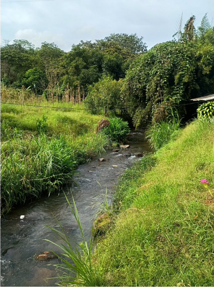
Un des cours d'eau de la finca

De Pablo Rebetez - Soutenir l'action des femmes, protéger les jeunes Un projet de coopération par l'envoi de personnes de Comundo