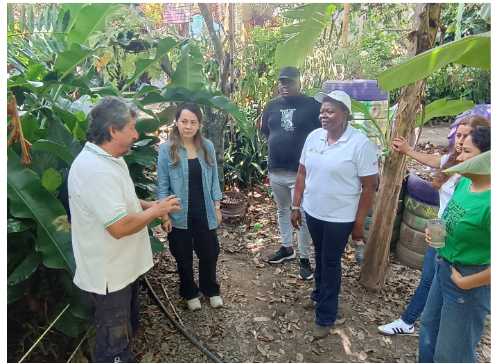
Le fondateur de la Pura Vida nous explique.

Le projet de cette famille a évolué avec le temps, passant d'une production familiale à une production permettant de vendre sur les marchés paysans. Ils comptent sur cet espace de moins d'un hectare une énorme variété d'aliments: 46 espèces de fruits, 150 variétés de légumes et de plantes comestibles, cochons, poissons et poules pour la consommation domestique. Une vraie oasis pensée et construite avec minutie.