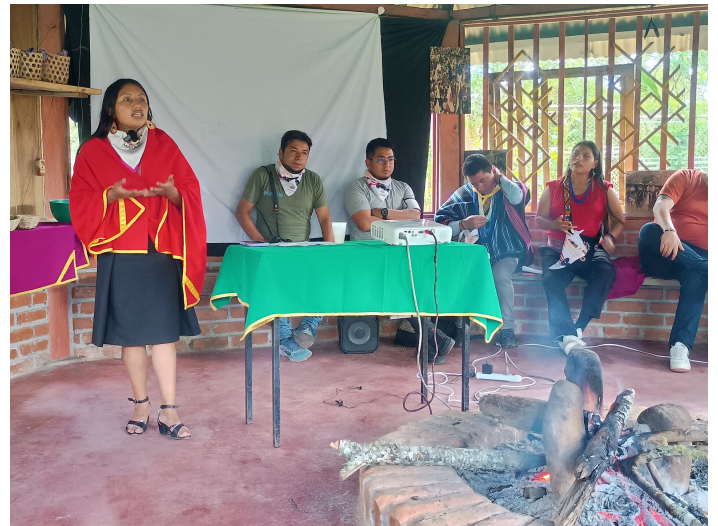
Jeunes de la communauté Kamèntsá (Putumayo)

Durant cette première partie de l'année, j'ai eu l'occasion d'échanger avec des jeunes de différentes régions du pays: Boyacá, Valle del Cauca, Nariño, Putumayo. Difficile de résumer ce que j'ai vécu mais je peux vous dire qu'il y a chez eux une force et une résilience qui naît probablement des contextes dans lesquels ils grandissent.