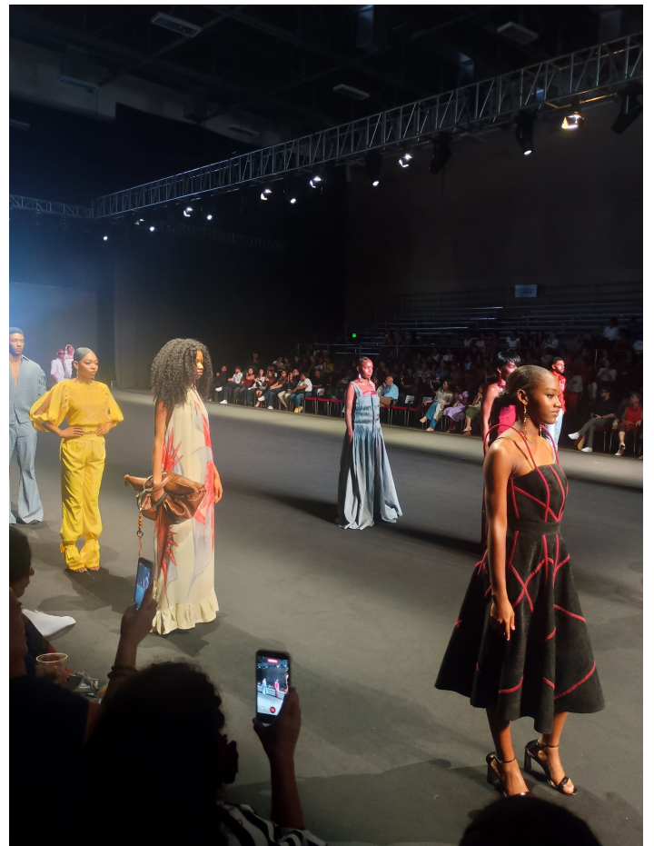
Défilé de mode à Cali Distrito Moda