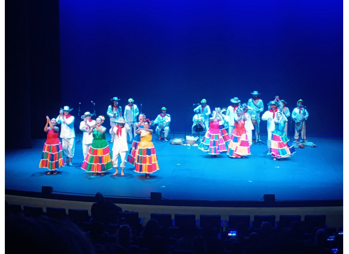
Danses folkloriques de la côte atlantique