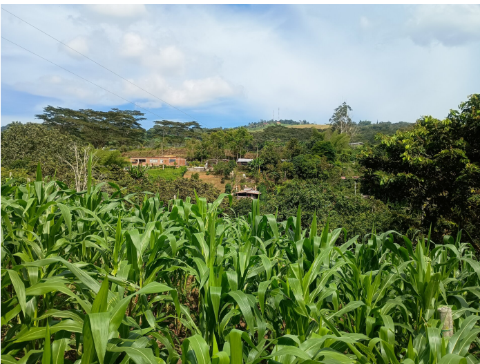
Les champs de maïs sur les hauteurs de la finca.