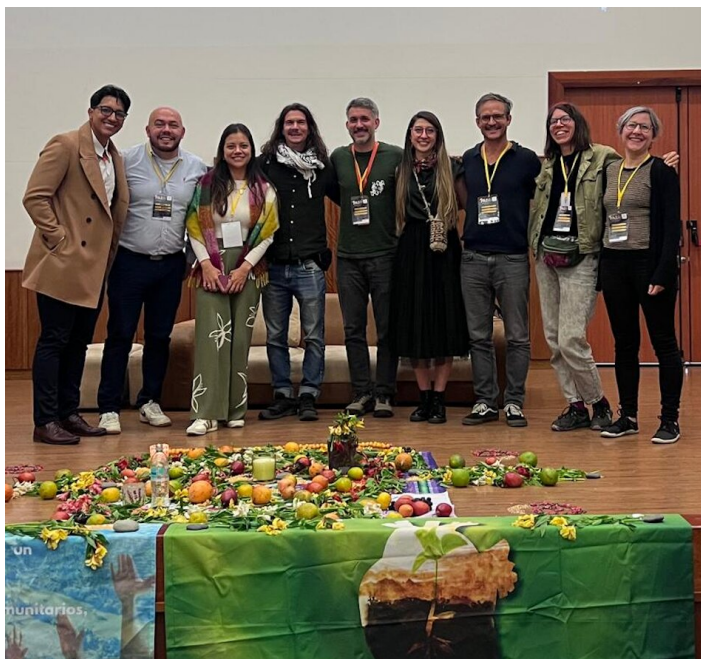
Avec une partie de l'équipe de Comundo à Pasto

Un projet de coopération par l'envoi de personnes de Comundo