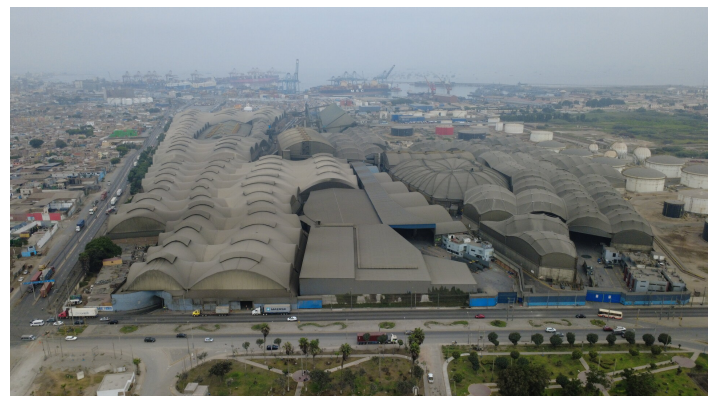
Trafigura, IXM, Glencore - Erzdepos am Hafen in Lima

Die Bilder vermitteln leider nur wenig von den Dimensionen – dafür wäre Film auf Grossformat besser. Ende August plane ich vermutlich einen Abend in Zürich, um mehr zu zeigen und zu erzählen, und lade hier schon mal herzlich dazu ein! Ich würde mich freuen.