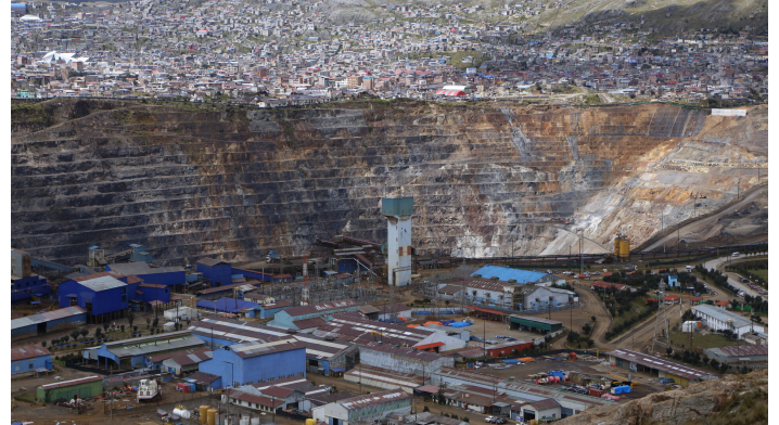
Die Mine mitten in der Stadt Cerro de Pasco

Die enormen Löcher, Schutthalden und giftroten Schlackeseen mit eigenen Augen zu sehen, und gelegentlich auch zu riechen, war sehr eindrücklich. Dazu konnte ich Aufnahmen mit einer Drohne machen, was es zum Teil erst ermöglicht die ganze Dimension zu erfassen.