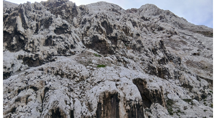
Fels wie mit Säure übergossen von der Schwefelluft