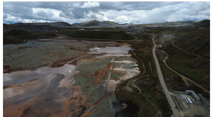
Mit Schlacke gefüllter See bei Cerro de Pasco