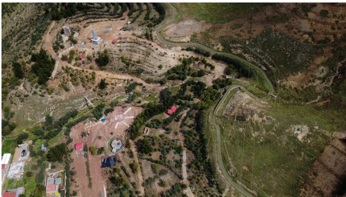
Der von den Frauen gepflanzte Wald nahe La Oroya