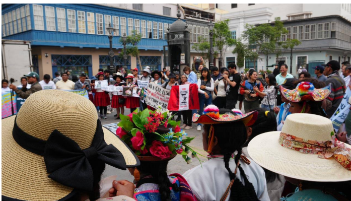
Versammlung der PLANAMETOX in Lima

Wir besuchten an beiden Orten die Lokalgruppen der Plattform der Betroffenen der Schwermetallverschmutzung, über die ich hier schon mehrmals berichtet hatte (Plataforma Nacional de Personas afectadas por metales tóxicos, planametox.org/ ).