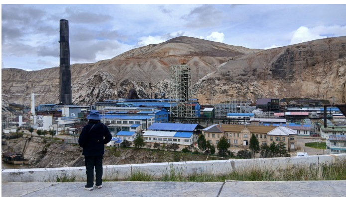
Das Schmelzwerk heute nicht in Betrieb