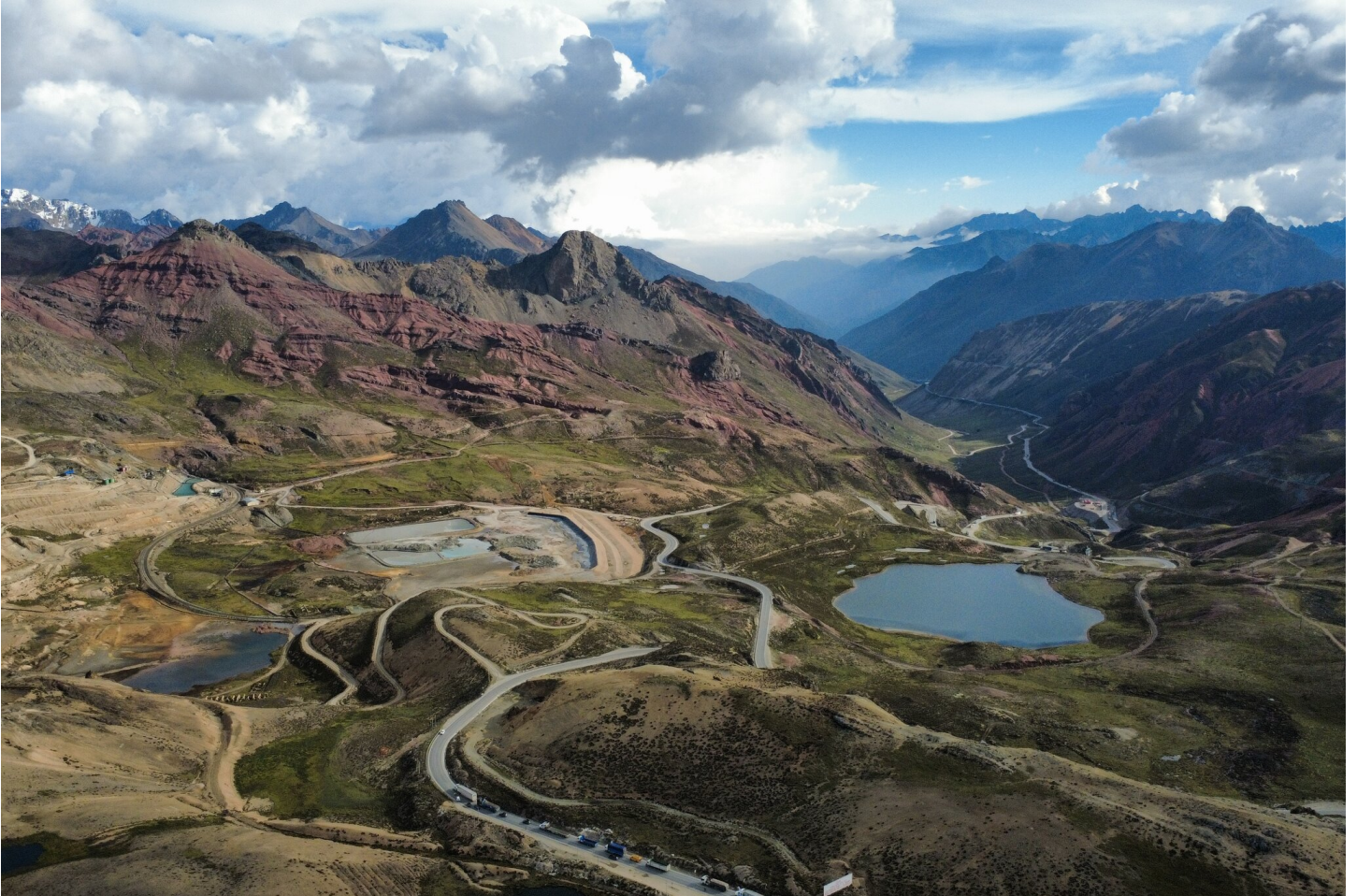
Ticio Pass auf 4818m, das Quellgebiet des Río Rimac, der Lima mit Wasser versorgt, mit Bergbauabraumhalden links im Bild.