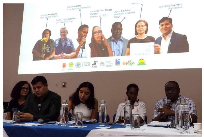
Gegen Gewalt während der Wahlen: Ein Podium organisiert von der Pastoral Social in Cali

Gemeinsam mit der Pastoral Afro und dem Observatorio de Realidades Sociales der Erzdiözese Cali arbeiten wir in einem engen Verbund mit weiteren Organisationen wie Paz y Bien und Justapaz. In diesem gemeinsamen Cluster bündeln wir unsere Ansätze, um präventiv auf die steigende Gewalt und insbesondere auf die Rekrutierung Minderjähriger zu reagieren.