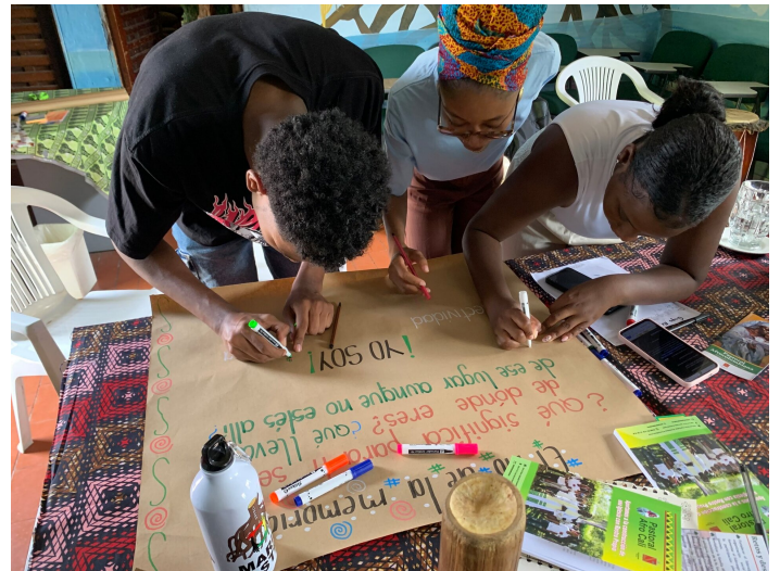
Workshop mit jungen Menschen

Besonders wichtig ist uns die aktive Beteiligung der Jugendlichen. Sie sind nicht nur Teilnehmende, sondern gestalten den Prozess selbst mit. Sie entscheiden mit, welche Themen relevant sind, welche Methoden angewendet werden und wie die gemeinsamen Räume aussehen sollen. Dadurch entstehen Erfahrungen von Selbstwirksamkeit und Verantwortung, die in einem von Gewalt geprägten Kontext von großer Bedeutung sind. Sie entwickeln Initiativen, stärken lokale Netzwerke und schaffen neue Perspektiven in ihren Vierteln und Gemeinden.