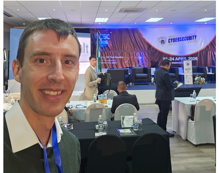
Cybersecurity-Konferenz in Windhoek im April 2026.

Das Gefälle. Gleichzeitig hatte ich das Gefühl, mich in einer Art «Bubble» zu bewegen. Für alle Teilnehmenden der Konferenz war die enorme Wichtigkeit von Cybersecurity glasklar.