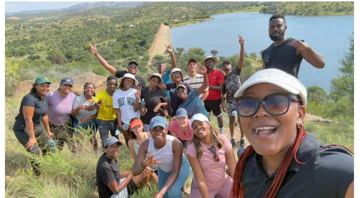
Teamwanderung am Avis-Damm.

Die Woche endete erneut mit einem Teamtag. Während letztes Jahr vor allem Wettbewerbe und Challenges im Zentrum standen, begann der Tag dieses Mal mit einer Wanderung auf einen Berg und anschliessendem Aquafitness, genau mein Ding. Die späteren Spiele habe ich ausgelassen und festgestellt, dass ich damit nicht allein war. Es hat mir wieder gezeigt: Innerhalb einer Kultur haben Menschen zwar vieles gemeinsam, am Ende sind aber doch alle individuelle Persönlichkeiten.