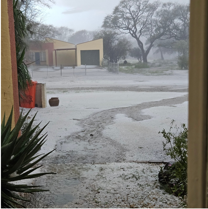
Blick aus der Haustüre nach dem Hagelsturm.