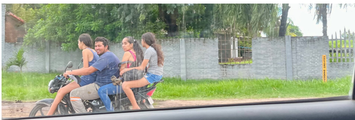
4 Erwachsenen und 1 Baby auf dem Moto

Rund ein Viertel der bolivianischen Bevölkerung kann sich keine gesunde Ernährung leisten. Klima- und Bevölkerungswandel erschweren den Zugang zu nahrhaften Lebensmitteln zusätzlich. Mit der zunehmenden Urbanisierung steigt zudem die Nachfrage nach Lebensmitteln, was Probleme bei Verfügbarkeit, Qualität und Zugang weiter verschärft. Viele Familien greifen deshalb zu günstigeren Produkten – oft zu Junkfood. Gleichzeitig werden chemisch-synthetische Pestizide und Düngemittel weit verbreitet eingesetzt, mit ernststen Folgen für Gesundheit und Umwelt.