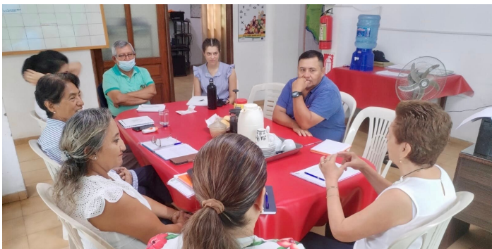
Erste Sitzung mit dem Incade-Team

Die Leute sind super freundlich. Die Gastfreundschaft ist tatsächlich eine typische Eigenschaft dieser Region Boliviens, und man spürt sie sofort. Das Klima ist tropisch. Im Moment ist es sehr heiss und schwül, wir sind in der Regenzeit, aber es gibt trotzdem mehr Sonne als in Luzern im Winter. Montero hat über 120.000 Einwohner, aber es wirkt nicht so gross. Trotzdem ist es, im Vergleich zu dem, was ich gewohnt bin, ziemlich chaotisch. Mir scheint es eine sehr authentische Stadt zu sein; Touristen habe ich bisher noch keine gesehen. Ich fühle mich fast wie die einzige Ausländerin, und vielleicht ist genau das die perfekte Gelegenheit, vollständig in die lokale Kultur einzutauchen! Die Arbeit ist sehr interessant. Ich hatte bereits die Möglichkeit zu sehen, was vor Ort gemacht wird, und mit Studierenden, Lehrpersonen, Schuldirektoren, aber auch mit Privatpersonen in Kontakt zu kommen. Da es ein kleines Unternehmen ist, wirkt es wirklich wie eine Familie: Alle sind sehr herzlich und hilfsbereit, nicht nur was die Arbeit betrifft, sondern auch im Privatleben. Einige haben mich schon zu sich nach Hause oder zu Familienfeiern eingeladen! Das Arbeitstempo ist ruhiger als das, was ich gewohnt bin. Es gibt weniger Druck, mehr menschlichen Kontakt und mehr Teamtreffen. Und genau diese Kombination von Faktoren führt – auch wenn sie manchmal ineffizient wirken kann – oft zu den besten Resultaten.