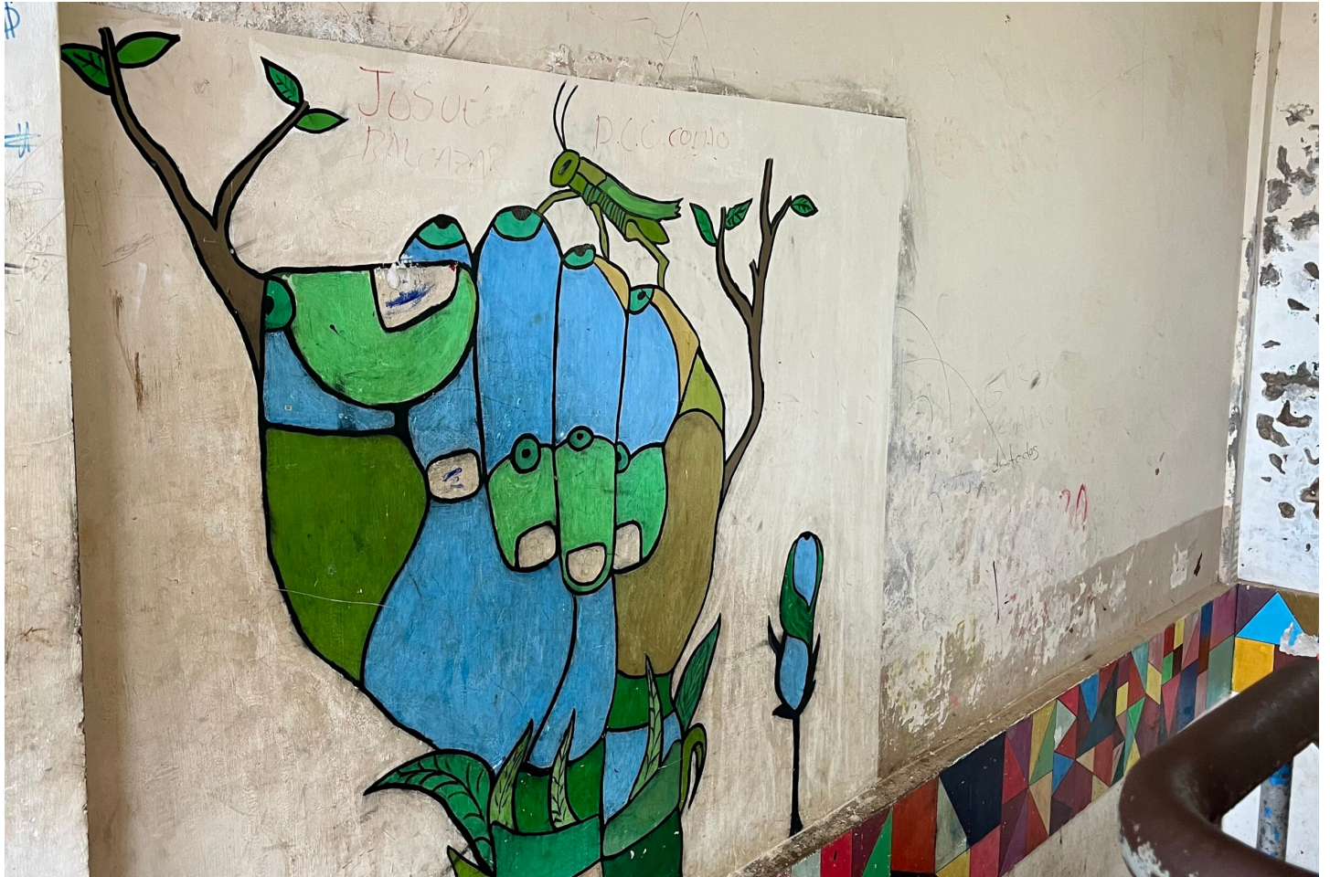
Wandbild von Schülern

Nach vielen Vorbereitungen, vielen Hürden mit dem Visum und einer fast 20-stündigen Reise bin ich nun endlich in Montero (Bolivien) angekommen – der Stadt, in der ich die nächsten Jahre leben werde.