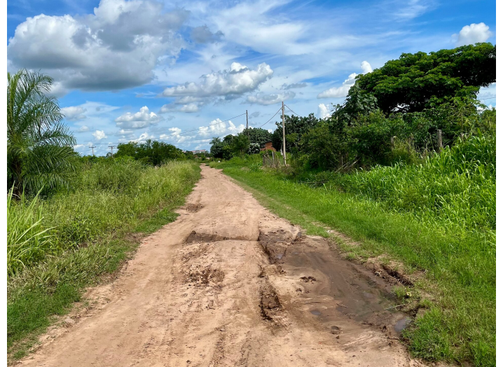
Bereit zu Kooperieren

Die Fachpersonen werden von Comundo sorgfältig ausgewählt, damit sie gut zu den Partnerorganisationen im globalen Süden passen – fachlich und auch menschlich. Vor dem Einsatz bereiten sie sich in einer intensiven Schulung auf ihre Aufgaben vor.