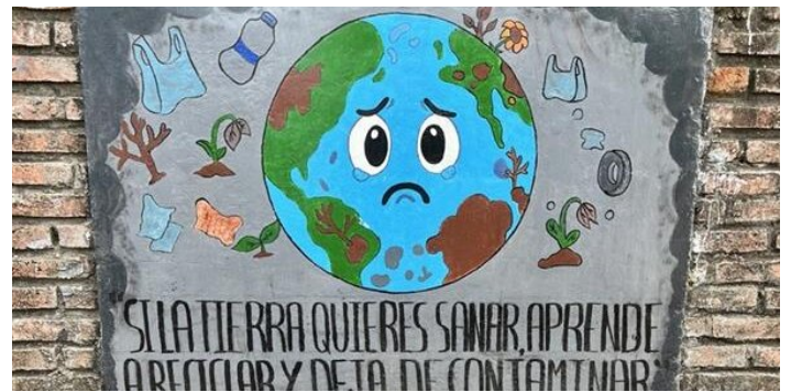
Ein Planet, alles ist miteinander verbunden

Wie im Reglement vorgesehen, liegt jedem Brief ein Einzahlungsschein für mögliche Spenden bei. Ich möchte jedoch betonen, dass ich von niemandem eine finanzielle Unterstützung erwarte. Wenn sich jemand entscheidet, die nachhaltige Entwicklung auf diese Weise zu unterstützen, wird diese Geste natürlich sehr geschätzt.