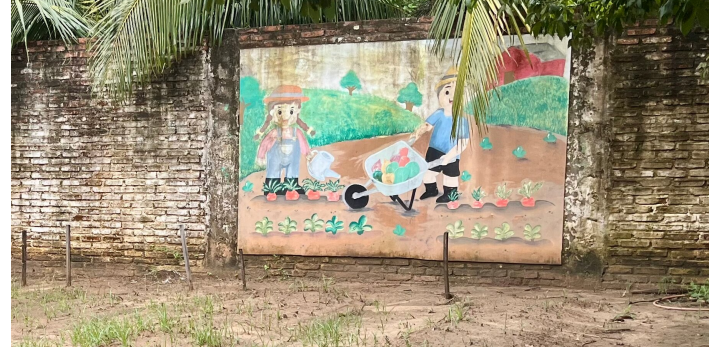
Gemüsegarten in progress