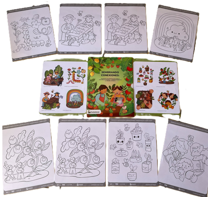
“Verbindungen säen” – Malbücher

«Eine Verbindung zur Natur in der Kindheit zu schaffen, ist der effektivste Weg, um eine nachhaltige und bewusste Zukunft zu gestalten. So entwickeln wir das Ernährungssystem und die Bürger von morgen von Grund auf.»