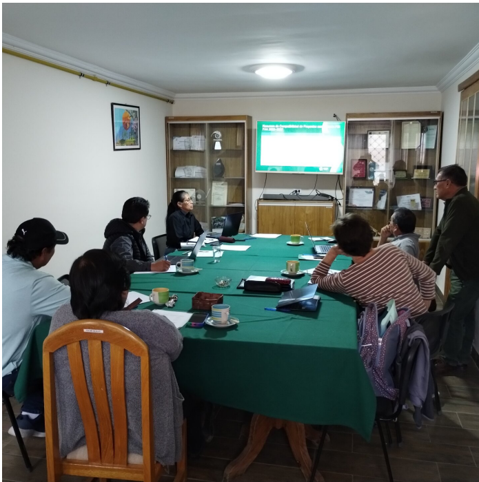
Sitzung mit dem Verwaltungsrat von Agrecol

In diesem Quartal haben wir Indikatoren überarbeitet, Ereignisse kategorisiert, Glossare entwickelt, um die institutionelle Sprache zu standardisieren, und Instrumente geschaffen, mit denen wir jede konkrete Maßnahme mit den strategischen Zielen des PEI (Institutioneller Strategieplan) von Agrecol Andes verknüpfen können.