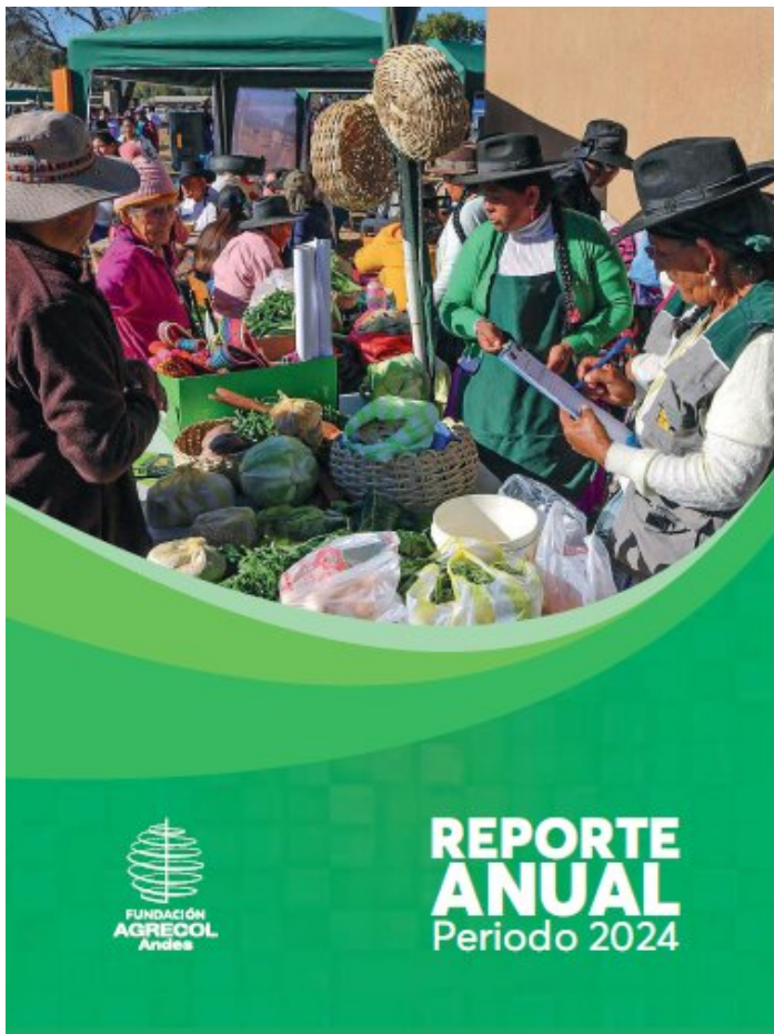
Jahresbericht 2024, Agrecol