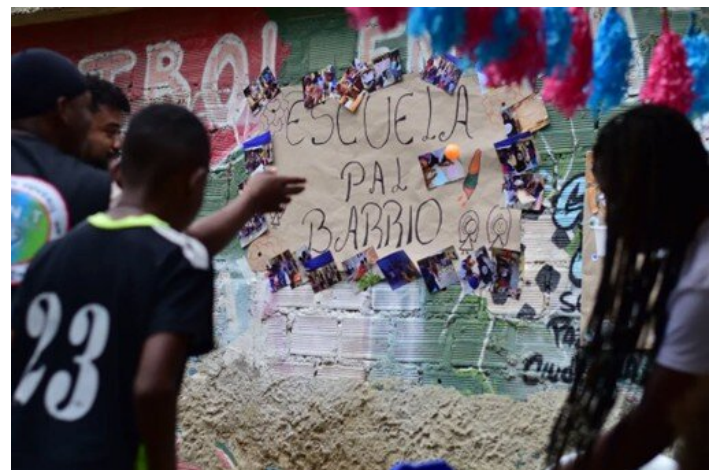
Schule fürs Viertel - ein Ansatz für Friedensarbeit

In diesem kurzen Bericht haben wir den Bogen geschlagen von den Finanzierungsproblemen friedlicher Zusammenarbeit, über die Problematik des bewaffneten Konfliktes in Kolumbien und städtischer Gewalt in Cali bis hin zu konkreten Antworten unserer Arbeit vor Ort auf diese massiven Herausforderungen. Daran zeigt sich vor allem, dass Friedensarbeit wichtiger denn je ist, um auch auf die großen Fragen globaler Politik eine Antwort zu finden.