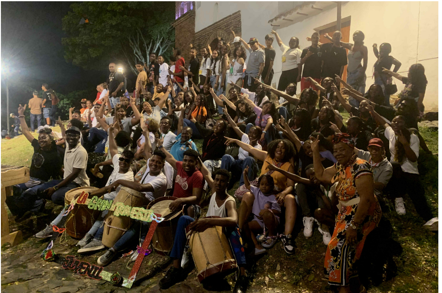
Jugendliche der Pastoral Afro bei einer kulturellen Aktivität im Zentrum Calis