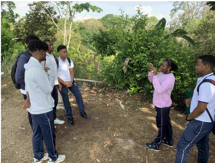
Jugendliche berichten aus ihrem Blickwinkel

Im Verlauf der beiden Tage arbeiteten die Jugendlichen an Führungsqualitäten, mündlicher Ausdrucksfähigkeit, Afro-Identität sowie der Förderung von kritischem Denken durch Kunst. Das Besondere daran ist, dass die Jugendlichen ihre unterschiedlichen Territorien und Kulturen kennenlernen. Denn während Jugendliche aus ländlichen Regionen ein Bewusstsein für ihre Afro-Territorien mit einer langen historischen Widerstandstradition entwickeln, kennen andere Jugendliche nur ihr Viertel mit überwiegend schwarzer Bevölkerung, die durch den Konflikt in Cali gestrandet ist und ihre Traditionen vom Pazifik mit in die Stadt bringt. Allein dieser Erfahrungsaustausch trägt zum Verständnis bei, dass die afroamerikanische Kultur vielfältig, kraftvoll und resilient ist und ein eigenes, jugendliches Antlitz besitzt.