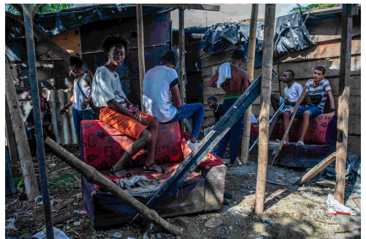
Jugendliche in Cali auf der Suche nach einer Zukunft

Kinder und Jugendliche gehören zu den primären Zielgruppen bewaffneter Gruppen, die ihre Präsenz in der Stadt in den letzten Jahren erheblich ausgeweitet haben. Nach aktuellen Erhebungen gibt es heute rund 112 bewaffnete Gruppen in Cali, die in unterschiedlichen Vierteln operieren, Territorien kontrollieren und informelle sowie illegale Wirtschaftsaktivitäten dominieren. Die Rekrutierung junger Menschen erfolgt häufig schrittweise. Kinder werden früh in Botengänge, Überwachungsdienste oder lokale Mikro-Vertriebsnetze eingebunden. Diese scheinbar harmlosen Tätigkeiten dienen dazu, sie an illegale Strukturen zu gewöhnen und Loyalitäten aufzubauen. Jugendliche werden später unter Druck gesetzt oder offen rekrutiert, um Teil bewaffneter Strukturen zu werden. Gewalt, Einschüchterung und wirtschaftliche Not spielen dabei eine entscheidende Rolle.