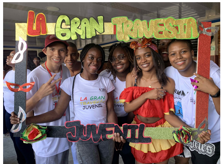
Jugendliche der Pastoral Afro bei der "Gran Travesía"

Die Teilnehmer*innen wandten partizipative Methoden an, um ihre spezifischen Kontexte im Viertel zu verstehen, zu beeinflussen und zu verändern – selbstverständlich unter Einbeziehung der Bewohner*innen. Denn wenn ein Viertel zusammenhält und gemeinsam öffentliche Parks und Räume zurückerobert, haben es auch illegale Akteure schwerer, Fuß zu fassen und junge Leute zu rekrutieren oder zum Drogenkonsum zu bewegen. Diese Sensibilisierungsarbeit ist ein Ansatz unter vielen, um der städtischen Gewalt in Cali etwas entgegenzusetzen.