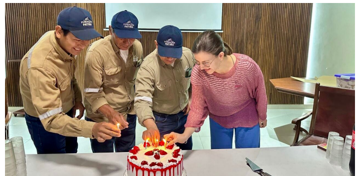
Cumpleaños di settembre