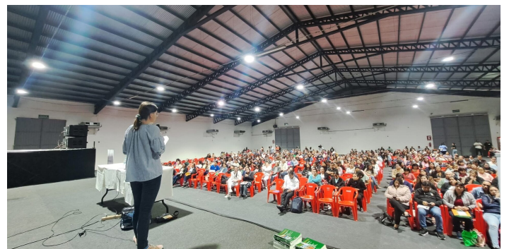
Fiera del Libro di Santa Cruz