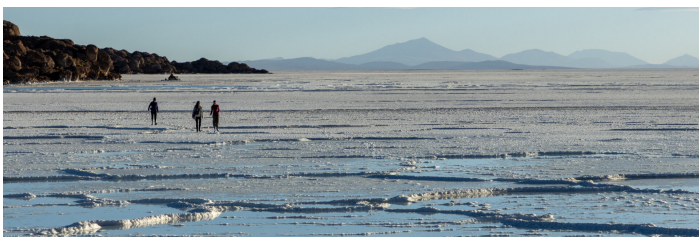
Vacanza al Salar di Uyuni