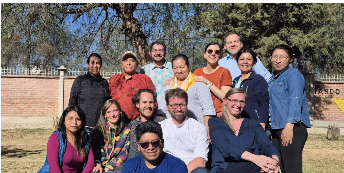
Team Comundo Bolivia