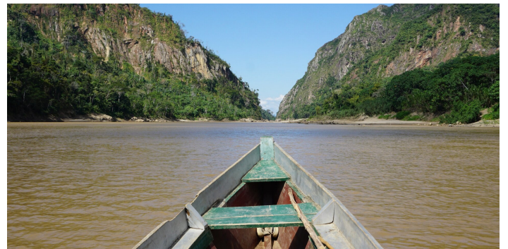
Vacanza al Parco Nazionale Madidi