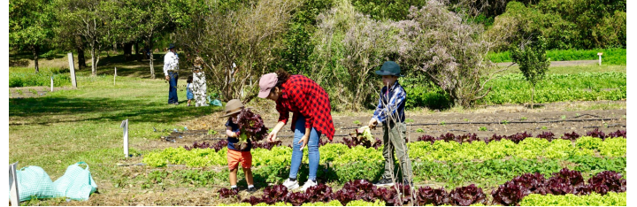
Porte aperte in Hacienda