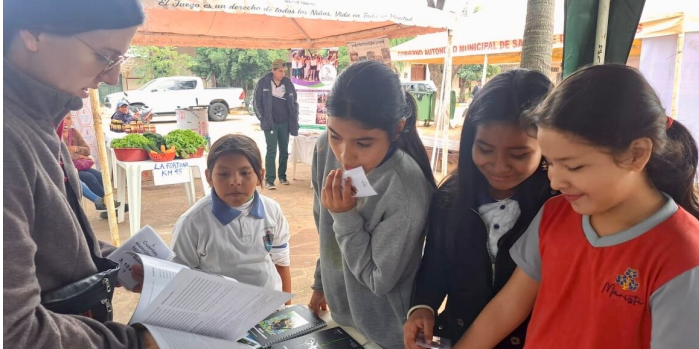
Fiera Interistituzionale dell'Educazione Ambientale

Di Lia Beretta - Rispetto per l'ambiente e alimentazione sana Un interscambio professionale con Comundo