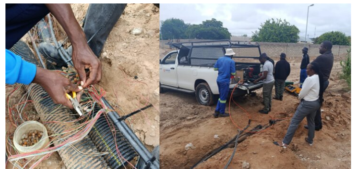
Internetkabel und ca. 200 Telefonleitungen zerrissen

Die im Stadtteil angegangenen Strassenbauarbeiten machen immer wieder Probleme: Wasserleitungen und Internetkabel wurden bereits mehrfach zerstört. Die Zufahrt zum Direktors Gebäude wurde nun geteert: Im Zuge dessen war das gesamte Office für zwei Tage ohne Internet.