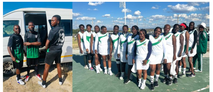
Fussballer und Netzbballerinnen

Der Event wurde mit einer grossen Eröffnungszeremonie gestartet; damit wir auch ein ordentliches Erscheinungsbild abgeben, wurden extra dafür einheitliche Trainingsanzüge bestellt. Alles musste seine Ordnung haben: Vor jedem Spiel mussten die Spieler verifiziert werden. Das komplette Team musste mitsamt Ausweis und dem letzten Lohnschein (abgestempelt und vom Management unterschrieben) kontrolliert werden. (Unglücklicherweise wurden genau im April landesweit keine Lohnscheine verschickt – dem Head Office war die Druckerfarbe ausgegangen. (Das ist aber ein anderes Thema.)