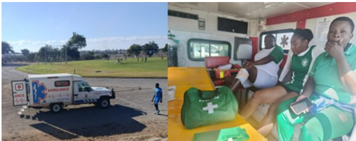
Ambulanz am Spielfeld, Aussen- und Innenansicht

Andere Spieler standen mit blutigen Bandagen am Kopf weiterhin auf dem Feld. Trotzdem wurde das Fussballkader mit jedem Spiel etwas kleiner. Ab dem zweiten Tag wurde vorsorglich eine Ambulanz direkt beim Sportplatz stationiert. Dies ist der einen Kollegin entgegengekommen, so konnte sie sich vor jedem Spiel unkompliziert Schmerzmittel ins Knie spritzen lassen.