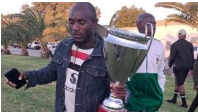
So reisen Sieger an: Mit Pokal.

Die Pokale der letzten Austragung wurden aufgrund fehlender Mittel kurzerhand zu Wanderpokalen erklärt. Damit war der Druck real: Ohne den Sieg würde man nicht nur keine Pokale gewinnen, sondern sogar zwei (!) verlieren.