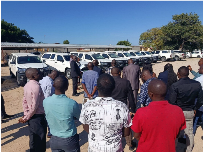
Einweihungszeremonie der langersehnten Autos

Im April war es dann wieder so weit: 20 Autos, wie bestellt, standen vor dem Direktoratsgebäude. Die gesamte Belegschaft wurde zusammengetrommelt, das Gebet fiel an diesem Morgen sehr überschwänglich und energetisch aus. Die Ansage der Direktorin war klar: Mit diesen Autos können wir nun bessere Arbeit leisten und auch unsere Aufgaben an den Schulen wieder alle wahrnehmen.