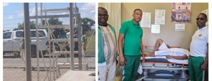
Beim Verladen ab dem Platz, Gruss aus dem Spital.

Es wurde mit extrem viel Einsatz gespielt, besonders beim Fussball gab es kein Halten. Unser Inspektor fiel bereits beim Eröffnungs-Showspiel mit Knochenbruch aus.