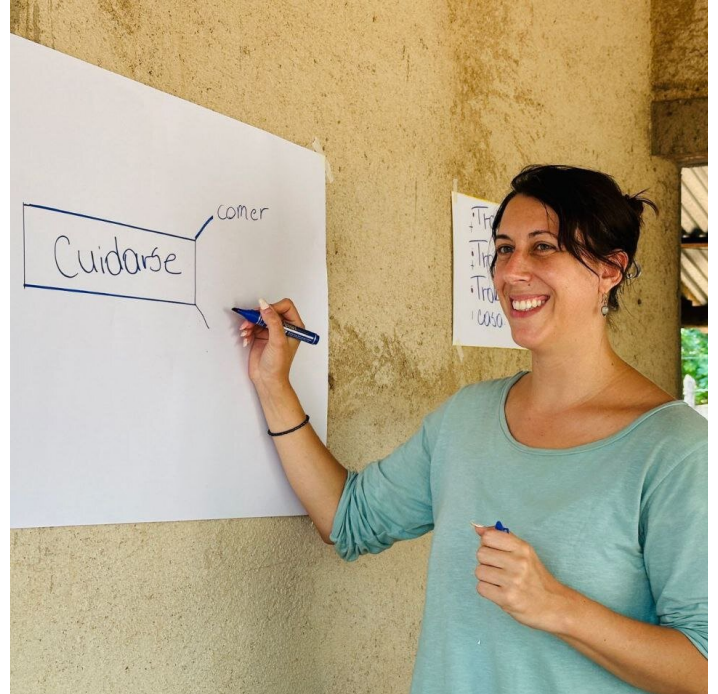
La Carbonera, Madriz, 2025

Durante l'ultimo mio atelier in una comunità, io e una collega della zona di Madriz abbiamo potuto sperimentare cosa significa fare un incidente in moto su una strada sterrata, in un'area poco frequentata e senza la possibilità di usare il telefono, e venirne fuori grazie alle cure meticolose e all'aiuto di famiglie della zona che per me erano fino ad allora delle persone perfettamente sconosciute.