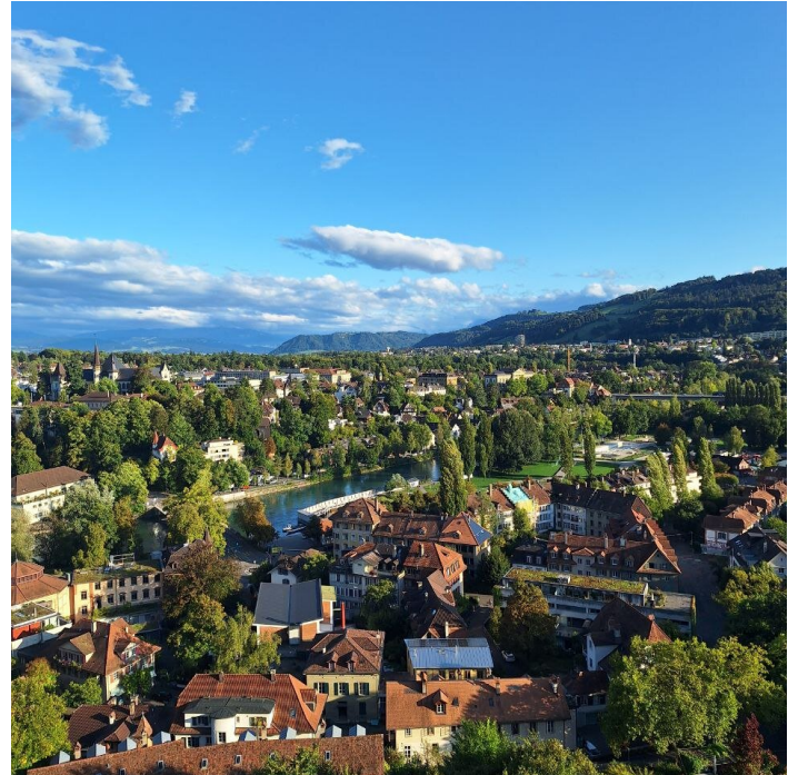
Berna, 2025 © Mandarano