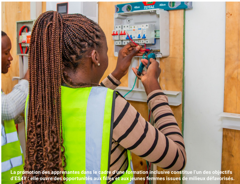
La promotion des apprenantes dans le cadre d'une formation inclusive constitue l'un des objectifs d'ES4Y : elle ouvre des opportunités aux filles et aux jeunes femmes issues de milieux défavorisés.